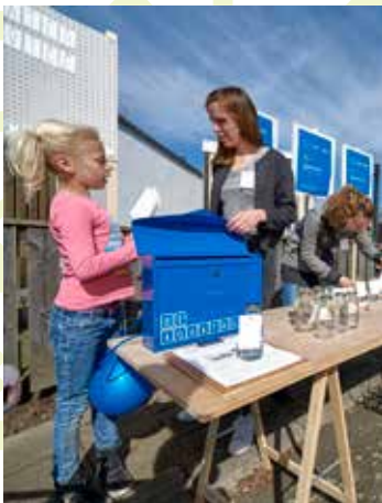
STROOMPUNT: BEWUST OMGAAN MET WATER IN EN OM DE WONING EN WIJK

Een duurzame toekomst is de verantwoordelijkheid van iedereen. Ook van Woonbedrijf. Wij gaan onze verantwoordelijkheid niet uit de weg. Integendeel: we omarmen de duurzaamheidsgedachte en verankeren duurzaam denken en doen in ons dagelijkse werk. En in de keuzes die we als organisatie maken op het gebied van nieuwbouw en renovatie. Dat duurzaamheid een integraal onderdeel van ons werk moet zijn, staat ook in ons koersplan. De weg die we in 2012 onderzoekend zijn ingeslagen, volgen we nu vol overtuiging. We inspireren elkaar en leren van elkaar. Ons motto: gewoon de goede dingen doen!