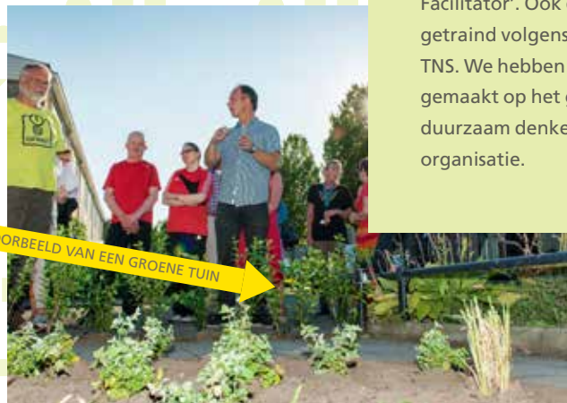
VOORBEELD VAN EEN GROENE TUIN